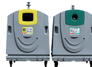
1m³ Emballages et papiers