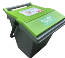
Emballages en verre