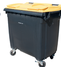
750L Emballages et papiers