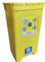
Emballages et papiers