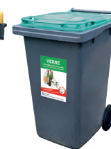
340L Emballages en verre