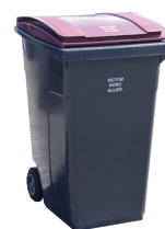
340L Ordures ménagères