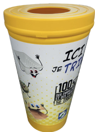
Emballages et papiers